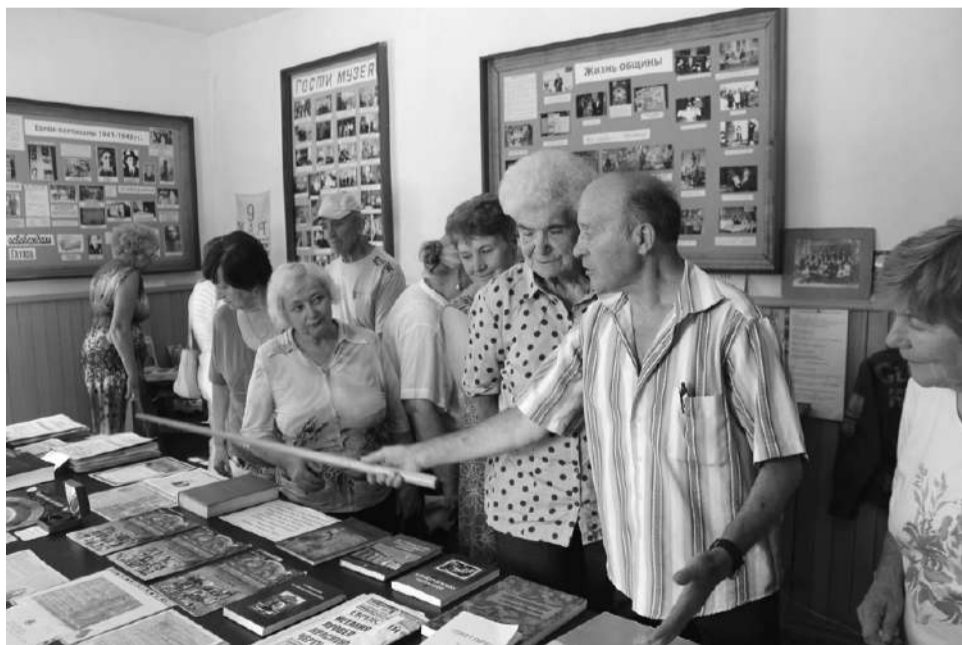
Гости из Чернигова в Музее истории евреев Глухова

В 2015 году Глухов посетила делегация еврейской общины Чернигова. Все участники той поездки прекрасно помнят