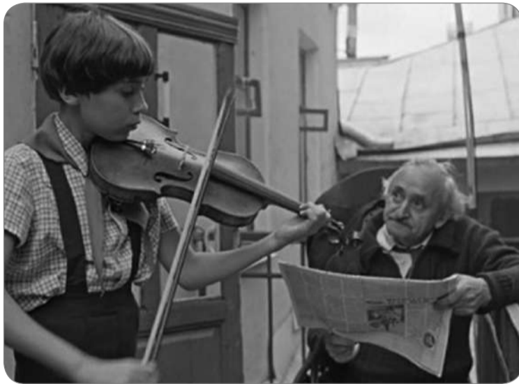
«Играй, Яшенька, играй!» (кадр из х/ф «Покровские ворота»)

и снова. Повторял, но... без особого успеха... И тогда отец подозвал крутившегося тут же Виолика, показал ему ноты и попросил: «Сыграй». И Виолик с готовностью согласился! И чудно мне было видеть, как маленький светловолосый кудрявый мальчик пяти лет на маленькой скрипочке легко и свободно (без подготовки!) сыграл то, что у меня вызывало слож-