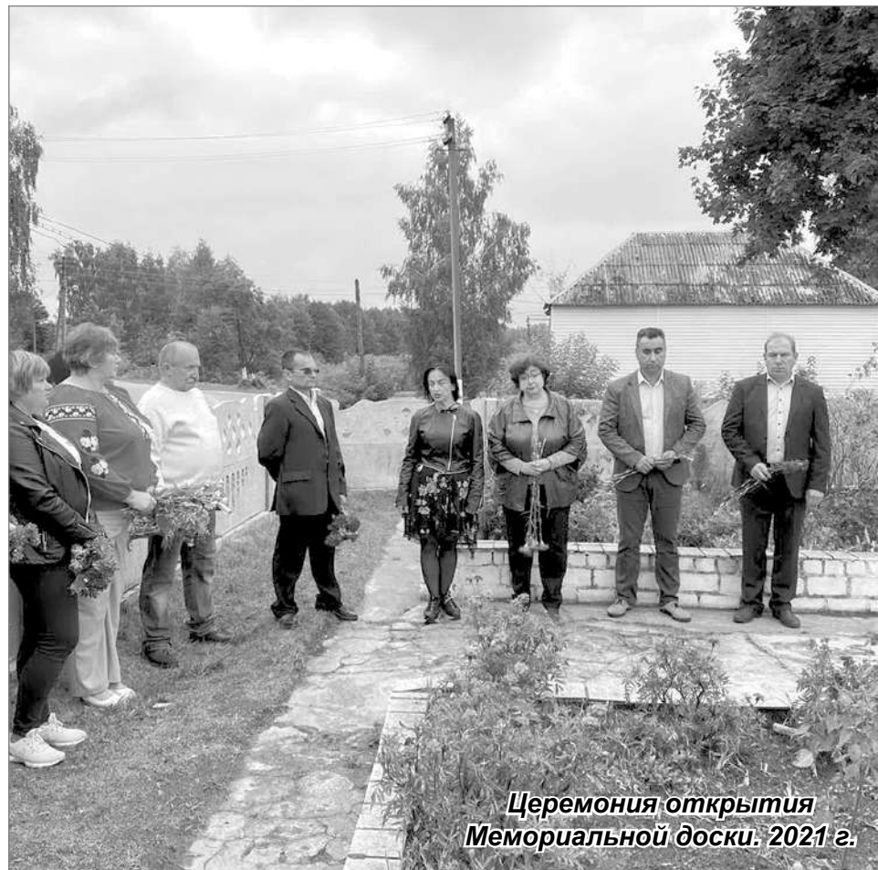
Церемония открытия Мемориальной доски. 2021 г.