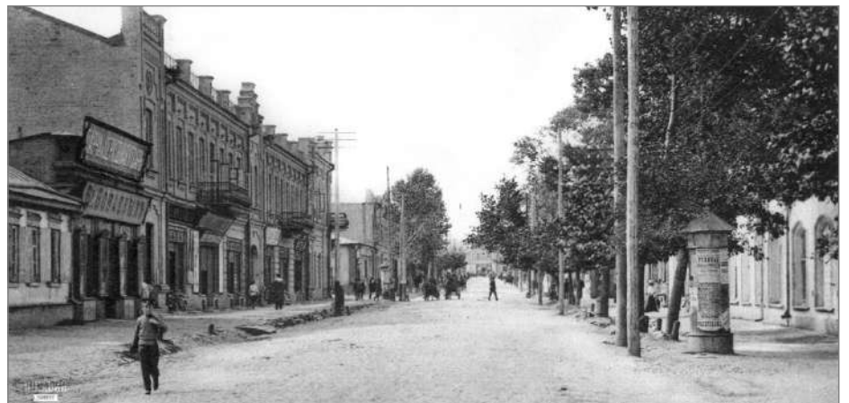
Вул. Шосейна (нині - проспект Миру). 1911 рік

та мистецької еліти. Дев'ятнадцятирічний юнак спромігся протиставити свій авторитет та волю безжалюї машині репресій — і тим самим багатьом зберіг життя. Згодом про нього лишисть коротенький запис у своєму щоденнику свідок тогочасних подій Дмитро Країнський: «Комиссар наробраза Идлис был интеллигентнее всех других. Он держал себя в высшей степени корректно, умно и деловито и производил на всех впечатление вполне приличного человека. Сюда бросилась укрываться от большевистского ужаса вся передовая интеллигенция. По общему мнению, Идлис был порядочный человек и, несмотря на свои юные годы, снискал к себе всеобщее уважение. Он