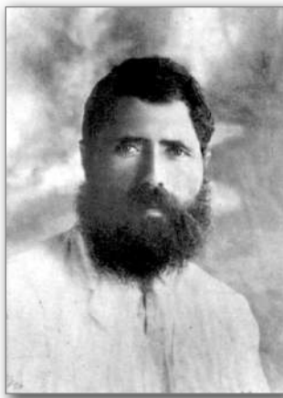
Йосеф Хаим Бренер

Будущий литератор родился 11 сентября 1881 в бедной еврейской семье в селе Новые Млыны Черниговской губернии. После учёбы в хедере и иешиве Йосеф Хаим переехал в Гомель, где вступил в Еврейскую социалистическую партию (Бунд). В Гомеле он опубликовал свой первый рассказ «Буханка хлеба», а затем, в 1901 году, — и сборник коротких рассказов. В 1902 году был призван в армию, но с началом русско-японской войны дезертировал и при помощи Бунда бежал в Лондон. В Лондоне Бренер редактировал и издавал журнал на иврите «Ха-Меорер» («Будильник») и принимал