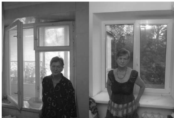
До... и после ремонта

Вот уже несколько лет в Киеве и Киевской области пожилым малоимущим евреям делает ремонты Фонд «Для тебя». На сегодняшний день более 200 семей смогли убедиться в том, что это реальная помощь, которая оказывается совершенно безвозмездно. Безусловно, средства ограничены, у фонда нет возможности полностью отремонтировать квартиру и помочь всем нуждающимся, но фонд продолжает изыскивать новые средства для помощи тем, кому это необходимо. Например, замена окон и новые откосы. Сразу становится теплее и светлее, нет проблем с открыванием и закрыванием. Многим знакомо чувство страха из-за неровного пола и дырок в линолеуме, пожилой человек опасается лишний раз пройти из комнаты в кухню. И совершенно потрясающее ощущение, когда твой старый пол вновь ровный и безопасный. Ночные страхи из-за того, что старую дверь можно открыть ногтем, тоже легко и быстро устраняются. Такие ремонты не только делают жизнь комфортней они ме-