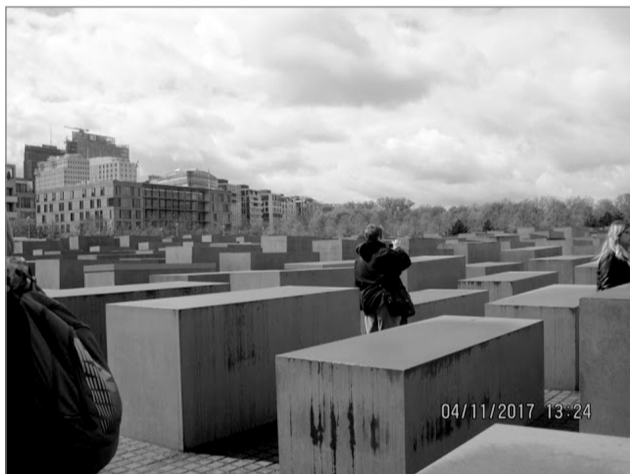
Пам'ятник убитим євреям.

Цікавий факт: попередньо записавшись і пройшовши через металодетектор, ви можете спокійно потрапити під скляний купол в Рейхстазі в Берліні (це аналог Верховної Ради в Україні). Скільки завгодно протягом дня можете перебувати там на екскурсії, милуватися краєвидами, які відкриваються з висоти. Але! В жодному разі ви не зможете сфотографуватися з прапором своєї країни на даху Рейхстагу! Це суворо заборонено після того як у 1945 році радянські військові встановили на цій головній споруді Берліна червоний прапор Перемоги. Німці глибоко переконані, що тут тепер має майорити тільки їхній державний прапор.