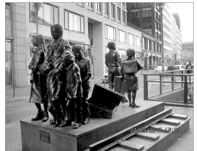
«Потяг життя. Потяг смерті» – символізує згоду Великобританії прихистити у себе дітей євреїв у 1938 році. Виїхати і врятуватися вдалося приблизно 2-ом з 7-ми.

Пам'ятник вбитим євреям. Він займає дуже велику площу, на якій розташовано понад 2 тисячі різних за розміром бетонних стел. Високі й низькі, широкі й вузькі, злегка нахилені, нема двох однакових, як нема двох однакових людей у світі. Ідея створення його саме в такому вигляді належить американцям. Під землею розміщено музей на 800 кв.м. Експозиції у вигляді фото знаходяться на стінах і підлозі. Про родину чи подію на світліні розповідає аудіогід на декількох мовах.