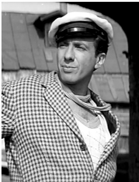
Сергей Юрский в роли Остапа Бендера