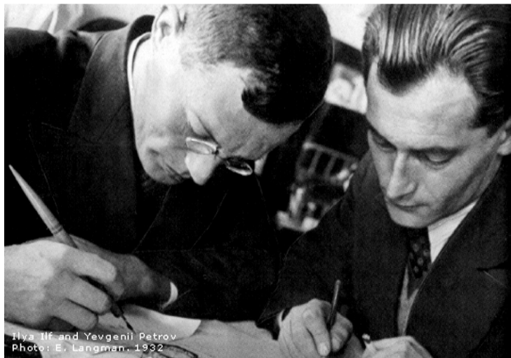
Илья Ильф и Евгений Петров, 1932 г.