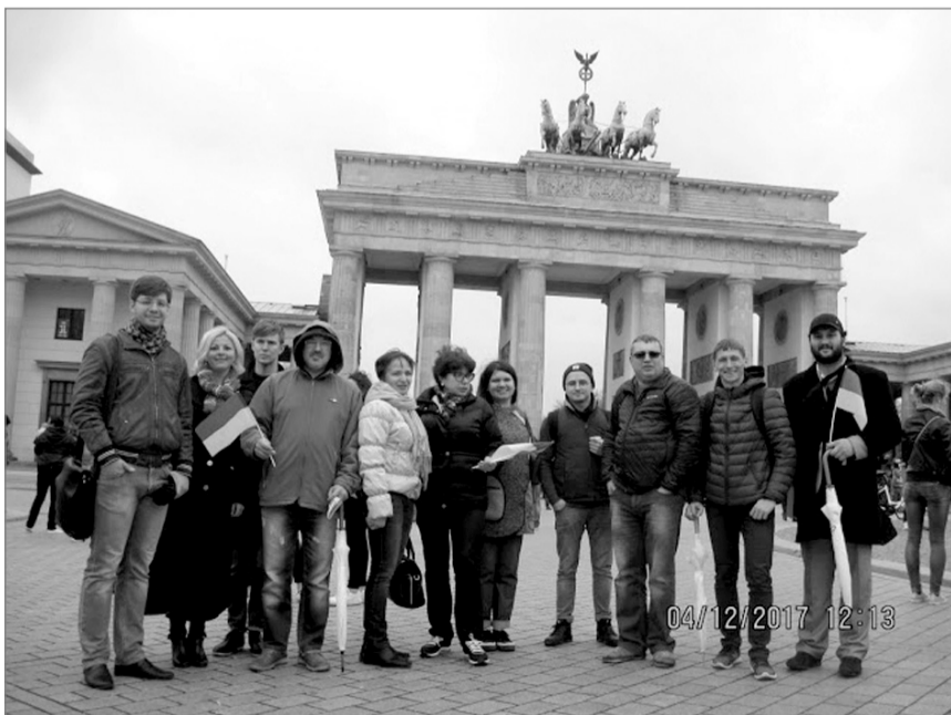
Делегація з України біля Брандербурзьких воріт у Берліні.

Антисемітизм, як ідеологія і політичний рух, спрямований на боротьбу з євреями, виник у Німеччині наприкінці 70-х років XIX століття. Поступово він ставав складовою частиною програми політичних партій. Саме його і використав Гітлер у період кризи 1930-х років, щоб привести до влади свою націонал-соціалістичну партію, яку її називали – нацистська. На виборах 1932 року нацисти отримали 33% голосів, а вже в січні 1933-го Гітлера призначають канцлером Німеччини. На той час багато його співвітчизників бачили в ньому спасителя. Новий канцлер домігся однопартійної диктатури і організував сили поліції для проведення такої політики діючи методом терору. Він переконує кабінет міністрів в необхідності від-