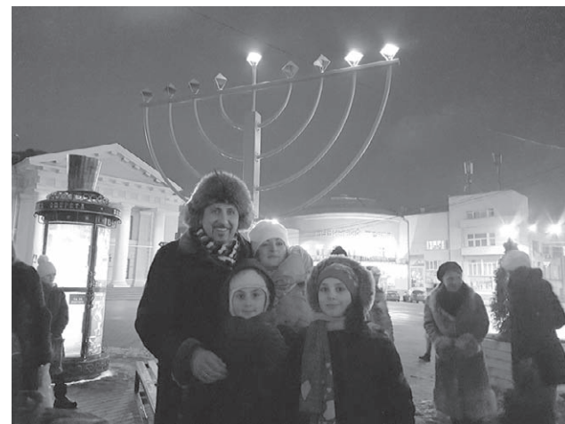
На фото: Реувен Стамов з дітьми

Першу свічку Ханукії запалив Головний рабин течії традиційного іудаїзму в Україні Реувен Стамов.