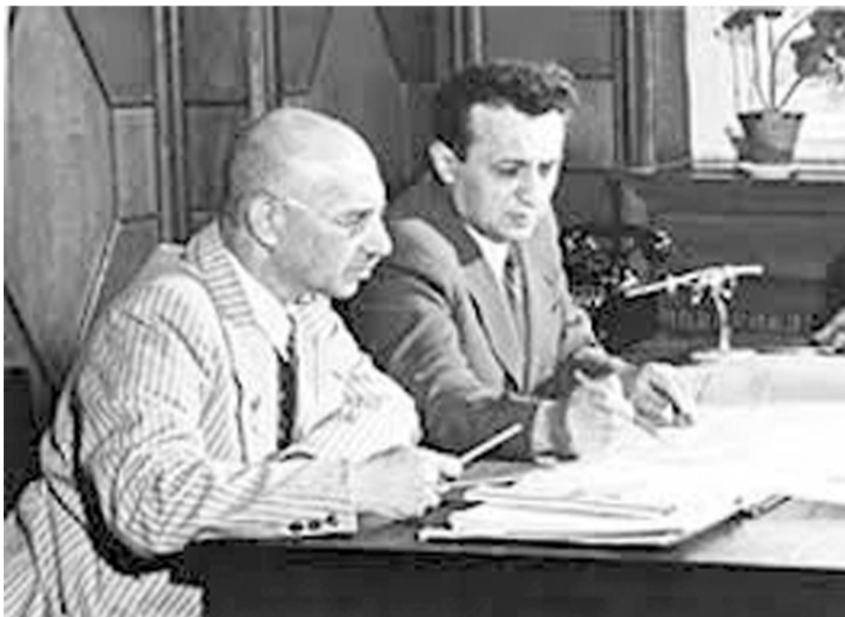
Михаил Гуревич и Артём Микоян за работой

ступления знаю. Но в обоих случаях нельзя было не принять: в одном у абитуриента отец был лётчиком-инструктором в училищном полку, да и у другого ситуация схожая.