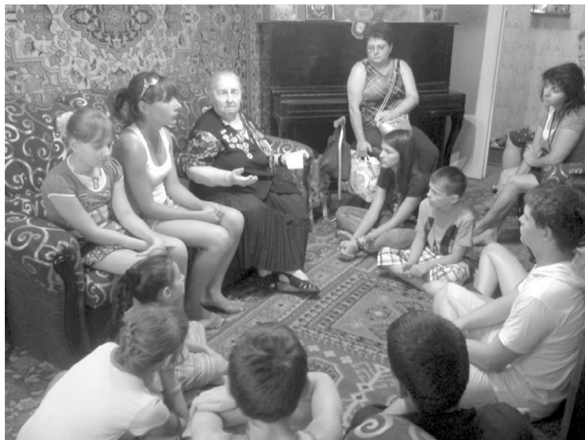
Украина. Чернигов, 2014 г.