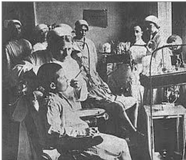
Детская зубоортопедическая больница в Одессе, субсидированная Джойнтом (1922 г.)

Здесь уместно напомнить, что «Джойнт» – это организация, и это слово звучит для непосвящённых неодушевлённо, но на самом деле за этим словом стоит помощь миллионов американских евреев своим еврейским собратьям везде, где она необходима. Эта помощь является уникальным примером благотворительности, не имеющим аналогов среди народов мира.