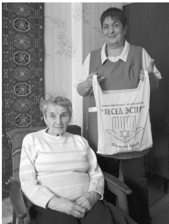
Украина. Чернигов, 2014 г.

В СССР работа «Джойнта» была запрещена Советским правительством ещё в 1938 году, а в 1953 году «Джойнт» был обвинён в соучастии в «заговоре врачей», в связи с чем его представителей выдворили из страны. Только спустя 50 лет, в период гласности и перестройки, деятельность Объединённого еврейского распределительного комитета «Джойнт» была возобновлена на территории Советского Союза. Став жертвой «холодной войны», «Джойнт» был изгнан также из Польши, Венгрии, Чехословакии, являясь объектом разнуданной, сфабри-