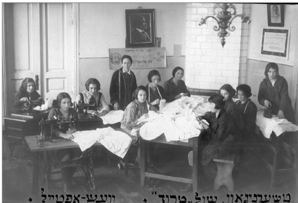
טשערניגאווי שול. טרום. וועג-אפטווייל. Черниговская еврейская школа «Труд». 1920-е

реполнили лагеря для перемещённых лиц. На помощь им пришёл «Джойнт».