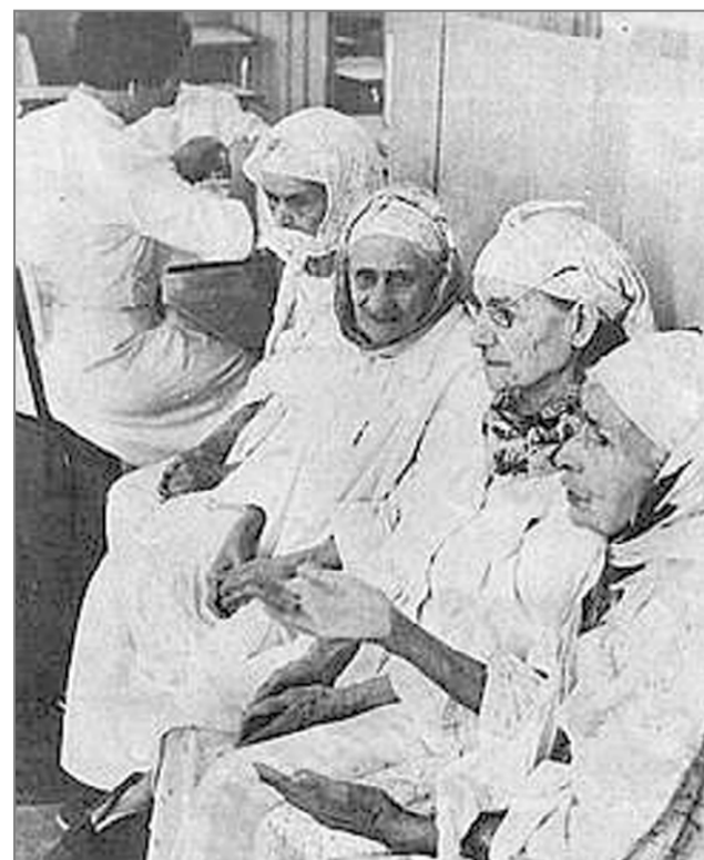
Дом для престарелых евреев в Касабланке, содержавшийся на средства Джойнта