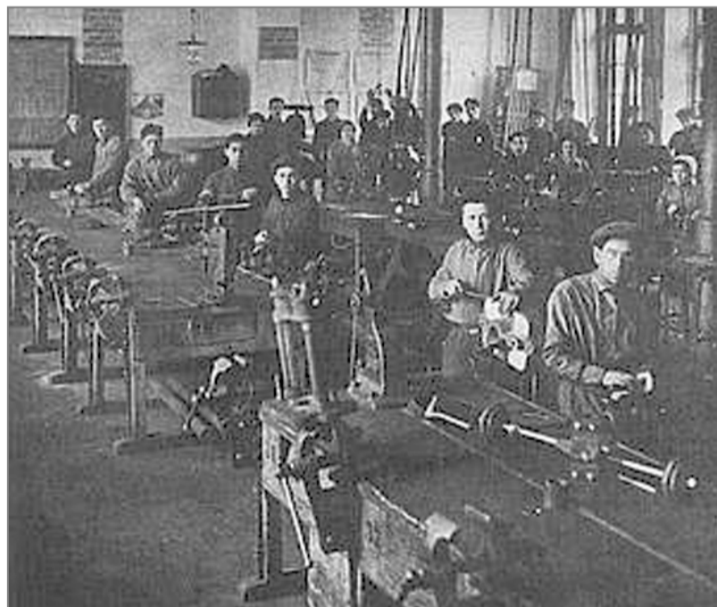
Курсы Агро-Джойнта при одесской школе-заводе еврейской рабочей молодежи, 1918 г.

С 1919 по 1923 годы направленные «Джойнтом» специалисты работали в Польше и России с местными еврейскими общинами по оказанию помощи в развитии здравоохранения, а также помощи в развитии религиозных, культурных и образовательных организаций. В 1922 году по соглашению с советскими властями во многих городах Советской России были открыты медицинские пункты, ссудные кассы и профессионально – ремесленные училища. В то же время в Советском Союзе «Джойнт» осуществил проект по созданию еврейских сельскохозяйственных