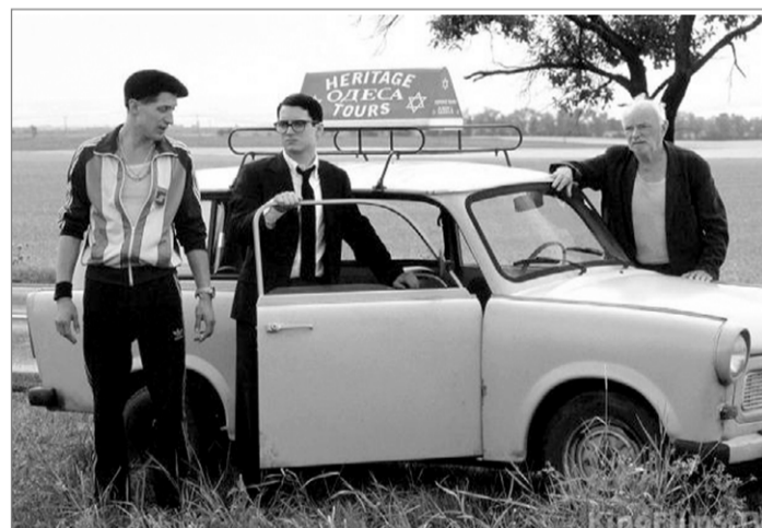
Кадр из фильма «Свет вокруг»

Украины. История и культура», в котором традиционно принимают участие наши и зарубежные историки, краеведы, работники музеев, архивисты, искусствоведы, журналисты (подробно о нынешнем семинаре читайте в статье Виктории Мудрицкой на стр. 2).