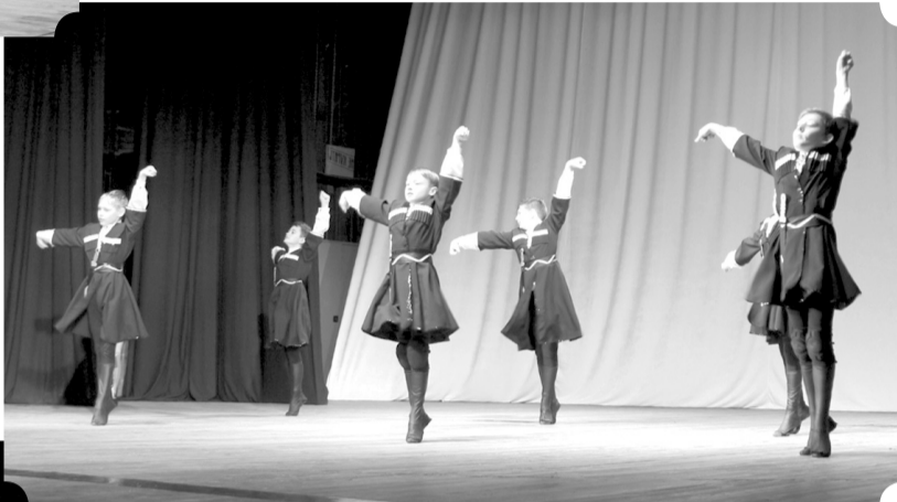
Хореографічний ансамбль Чернігівської школи мистецтв

Саме це стало головним мотивом нещодавнього впровадження в Чернігові проекту соціального згуртування «Сприяння відбудові та сталому розв'язанню проблем ВПО та постраждалого від конфлікту населення в Україні». Проект отримав назву «Чернігів – синергія успіху!», і впроваджується він Міжнародною організацією з міграції за фінансової підтримки Європейського Союзу.