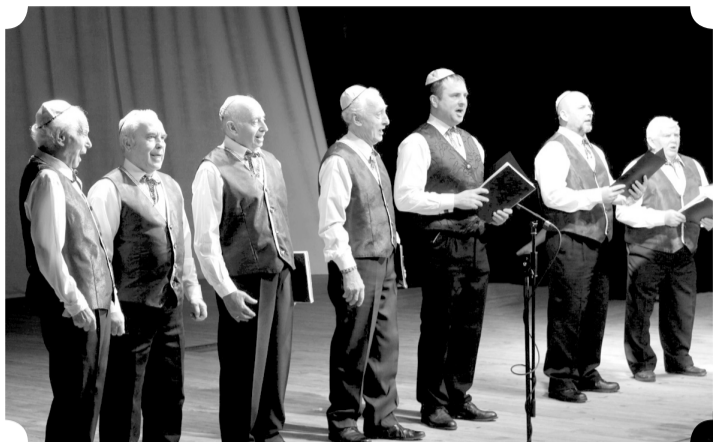
Вокальний ансамбль «Голдене менер»

Творчість національно-культурних товариств Чернігова презентували на фестивалі найталановитіші представники єврейської громади та Благодійного єврейського фонду «Хасде Ес-