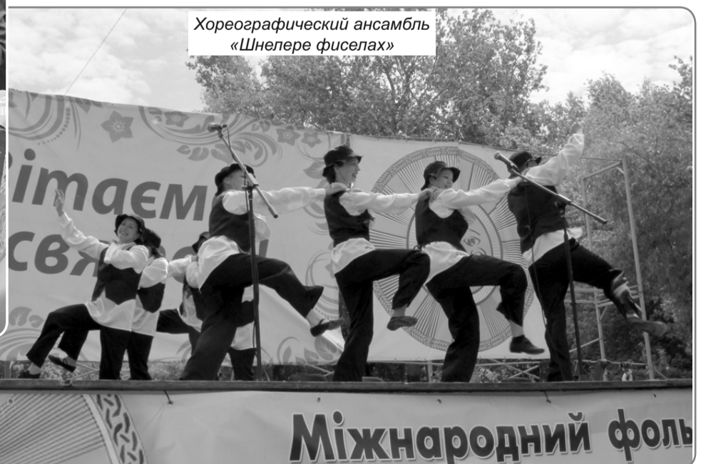
Міжнародний фольклорний фестиваль національних культур «Поліське Коло»