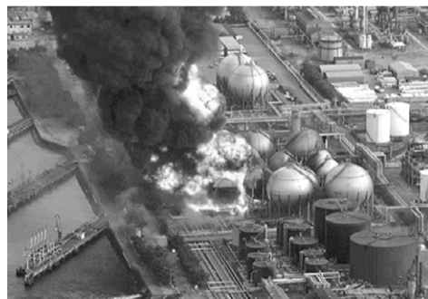
Взрыв на АЭС «Фукусима-1»

гут распространиться на большую часть территории страны, тем самым увеличив риск радиоактивного облучения ее граждан. Ученые из компании Pluristem провели ряд исследований: получая стволовые клетки из эмбриональных тканей, они их обрабатывали и вводили тем, кто подвергался смертельному уровню радиации. Эксперименты на животных показали хорошие результаты: у них были восстановлены клетки, поврежденные