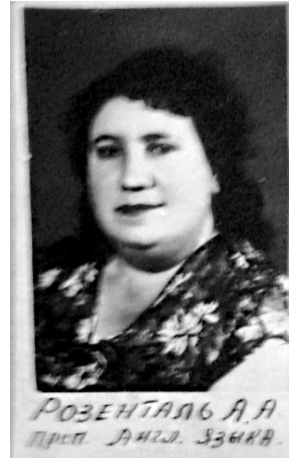
РОЗЕНТАЛЬ А.А. Др.п. А.И.Л. З.З.И.В.