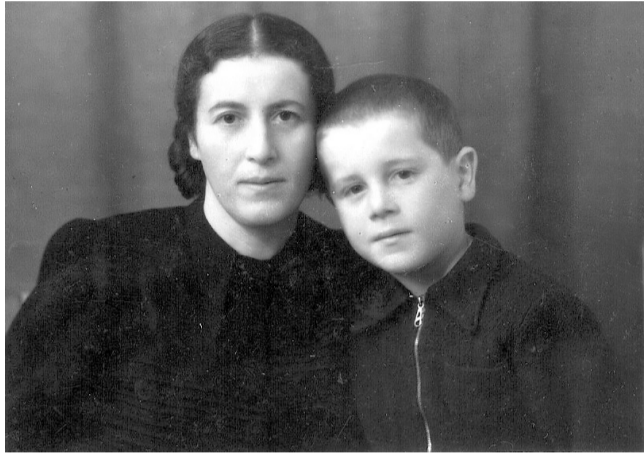
Мама и я. 14 января 1950 г.

Маша, Феня и Рая – мои тётки. Есть ещё и бабушка с дедушкой. А папа на фронте погиб. Семья у нас женская,