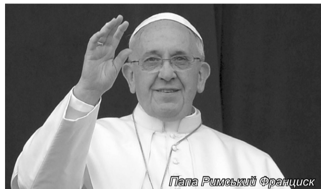
Папа Римский Франциск

Но в целом Святой престол делает всё возможное