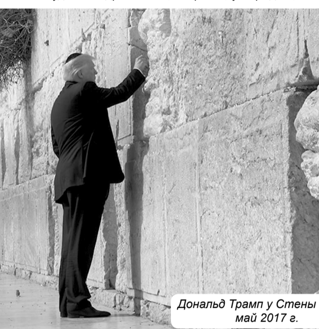
Дональд Трамп у Стены Плача, май 2017 г.

В 1003 году до н.э. Иерусалим был взят войсками Давида. Причём взят довольно легко. По библейскому рассказу (II Книга Царств), иевуситы выгнали на городские стены слепых, хромых и увечных – то ли для того чтобы вызвать страх во вражеских рядах, то ли в магических целях. Историк первого века н.э. Иосиф Флавий в своей книге «Иудейские древности», напротив, утверждает, что