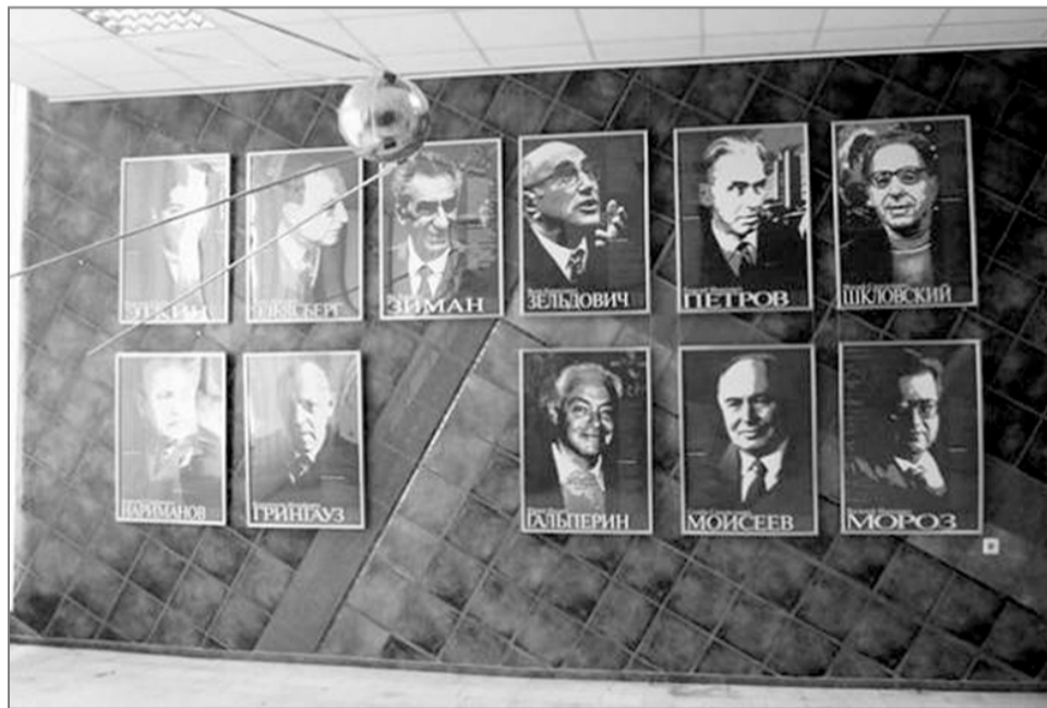
фото-фальшивку. Поэтому, будучи человеком дотошным, я решил перепроверить правдивость присланной мне информации. И для поиска нужных мне сведений я снова обратился к Интернету. Интернет, как известно, засорён разного рода сомнительной и часто недостоверной информацией. Поэтому я обратился исключительно к особой информации, а точнее – к... некрологам. Думаю, что никто не будет спорить с тем, что в некрологах и посмертных статьях об уже ушедшем в мир иной человеке пишут всю правду, даже ранее засекреченную.

Для пущей убедительности приведём несколько выдержек из таких посмертных сообщений, касающихся персоналий нашего списка.